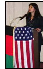
Sayu Bhojwani, NYC Commissioner of Immigrant Affairs discusses issues facing Afghan women.