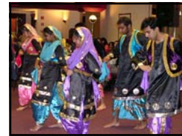
The Columbia University Bhan-gra Team gives an energetic, high intensity performance of South Asian folk dance.